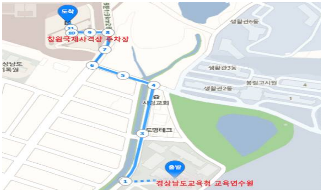
[창원국제사격장 주차장 위치]